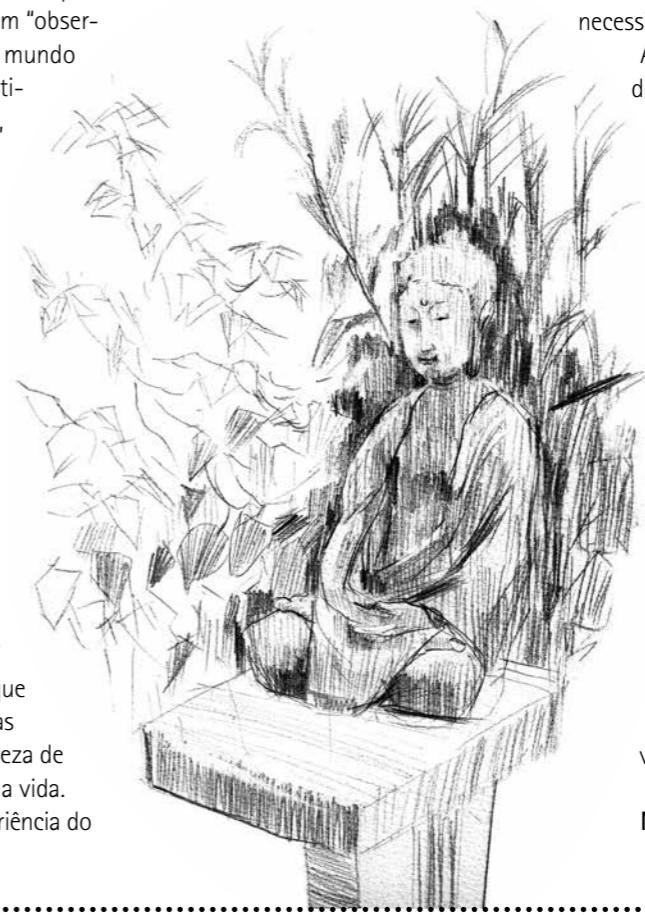
Ilustração: Zenshō Fernando Figueiredo

Xaquiamuni Buda surgiu da experiência do